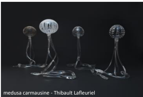
medusa carmausine - Thibault Lafleurriel