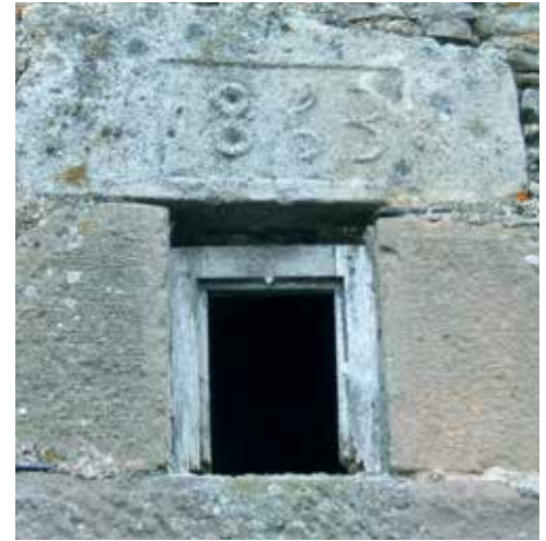
Détail d'une maison - Le Ségur AVANT - APRES TRAVAUX

En effet, le label ne peut pas être attribué lorsque le bâtiment est utilisé entièrement par son propriétaire pour les besoins d'une entreprise industrielle, commerciale, artisanale, agricole ou pour l'exercice d'une profession non commerciale.