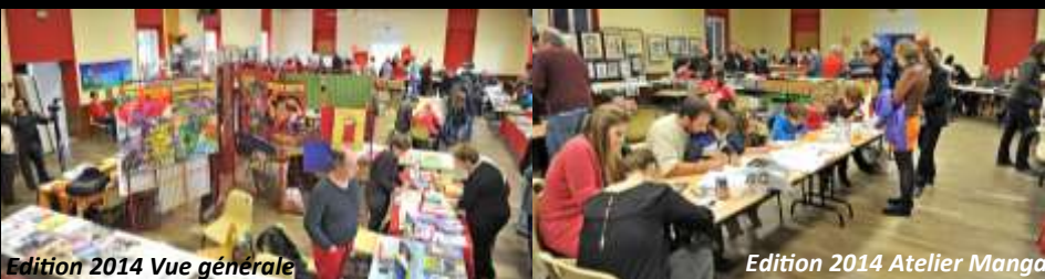
Edition 2014 Vue générale

Vers 18h : Tirage de la bourriche. Clôture à 18h