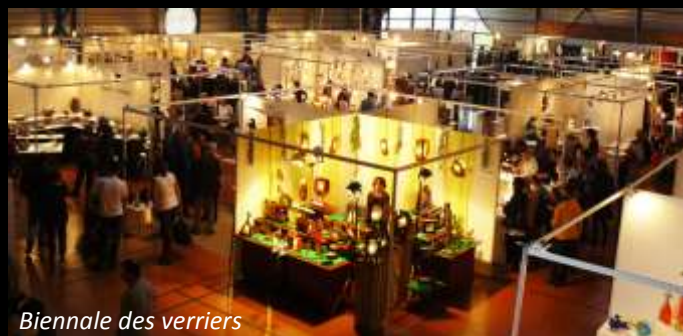
Biennale des verriers

21h / Cinéma de Carmaux : Projection du film-documentaire « le Dernier Souffle » suivie d'un débat avec l'équipe du film. Entrée gratuite, sur réservation (05 63 36 14 03)