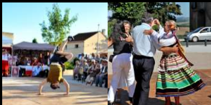
Edition 2014 : Hip hop et danses traditionnelles polonaises

RENSEIGNEMENTS : Foyer Rural de Cagnac les Mines / Saint Sernin les Mailhoc