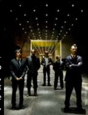
SECRETS CHIEFS 3