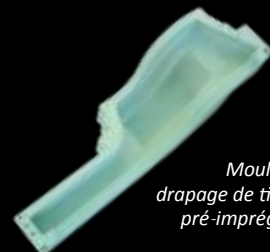
Moule de drapage de tissus pré-imprégnés

De nombreuses manifestations sont organisées sur notre territoire pour les Journées Européennes du Patrimoine, vous pouvez consulter le programme dans l' Interco'MAG Loisirs .