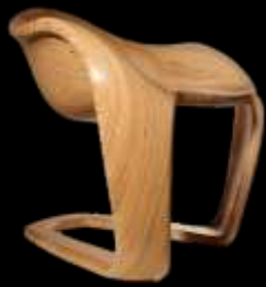
Maquette design de fauteuil

Par exemple, le CIRTES a conçu le procédé original breveté de Stratoconception et a développé le logiciel associé. Ainsi, l'objet final est réalisé par l'assemblage couche par couche de strates préalablement usinées.