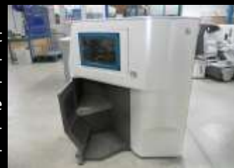
Maquette de meuble intérieur d'avion

Pour l'industrie, ils répondent aussi à certains besoins spécifiques. Des besoins qui peuvent aller de la conception de moules pour des pièces particulières à la réalisation d'habitacles d'autobus.