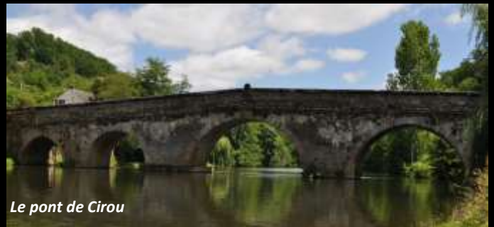
Le pont de Cirou

Les amateurs pourront repartir avec le mini-livret de leur histoire préférée.