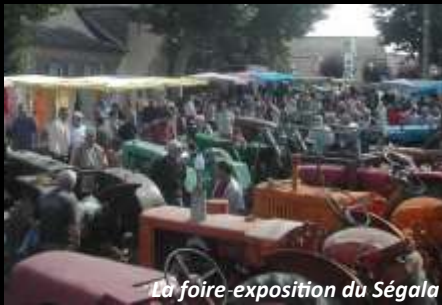
La foire-exposition du Ségala

Véritable fenêtre ouverte sur le Ségala d'hier et d'aujourd'hui, on y retrouve cette année encore les cinq pôles : Affaires, Découvertes, Patrimoine, Animaux et Habitat. Ainsi que le Salon régional du Ségala durable, le Festival du Patrimoine Rural du Ségala sans oublier, à partir de midi, le traditionnel repas « Veau d'Aveyron grillé à la broche et aligot de l'Aubrac » proposé sur réservation.