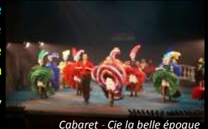
Cabaret - Cie la belle époque

Durant cette Comédie musicale, le public replonge au cœur de la Belle Epoque, autour des grands personnages d'Albi : Toulouse Lautrec, Lapérouse... dans un spectacle coloré et unique. Sur des musiques entraînantes, les jupes des danseuses virevoltent, lors d'un moment magique et inoubliable. Spectacle tout public interprété par de jeunes artistes de talent. Tarif adulte : 15€ - Enfants (moins de 10 ans) : 10€