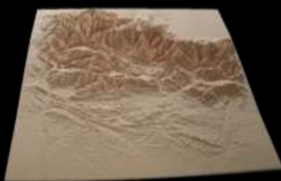
Maquette bas-relief Pyrénées