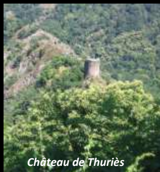
Château de Thuriès

Il proposera ensuite une improvisation autour d'une fresque sur les personnages légendaires locaux ; fresque réalisée par les Pitchous du Viaur (le centre de loisirs de Mirandol-Bournounac).