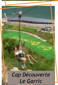
Cap Découverte Le Garric