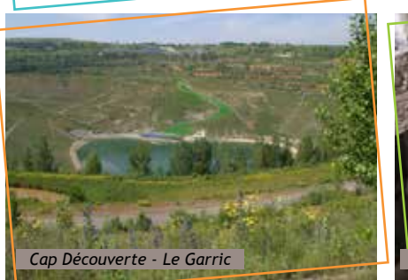
Cap Découverte - Le Garric