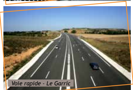
Voie rapide - Le Garric