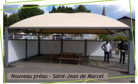
Nouveau préau - Saint-Jean de Marcel