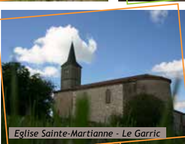
Eglise Sainte-Martienne - Le Garric