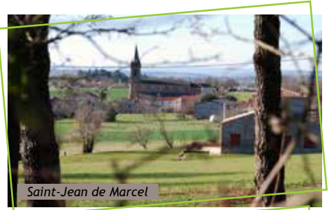
Saint-Jean de Marcel