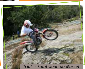
Trial - Saint-Jean de Marcel