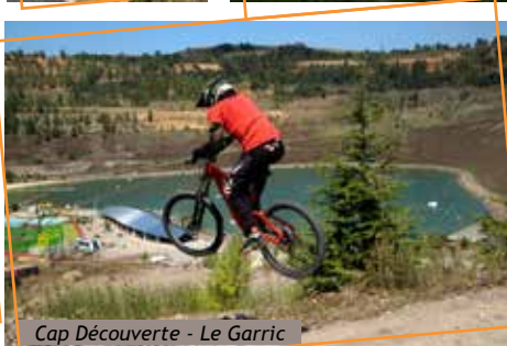
Cap Découverte - Le Garric