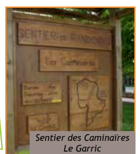
Sentier des Caminaires Le Garric