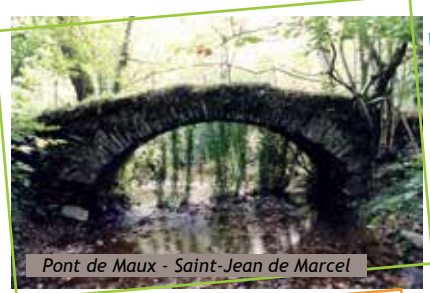
Pont de Maux - Saint-Jean de Marcel