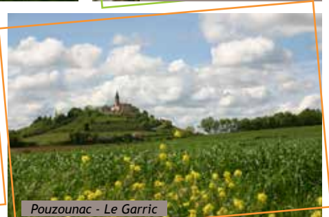
Pouzouac - Le Garric