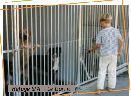
Refuge SPA - Le Garric