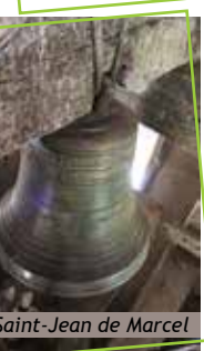
Saint-Jean de Marcel