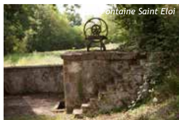
Fontaine Saint Eloi

En 2015, on recense 276 mailhocois et mailhocaises, soit une hausse de près de 23% par rapport à 1999. Au dernier recensement de 2017, la commune totalise 301 habitants.