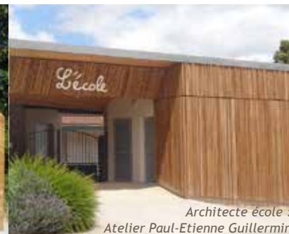
Architecte école : Atelier Paul-Etienne Guillermin