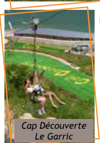
Cap Découverte Le Garric