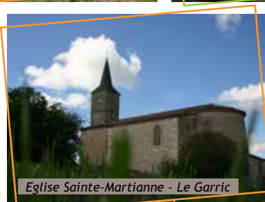
Eglise Sainte-Martienne - Le Garric