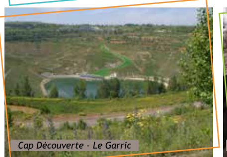
Cap Découverte - Le Garric