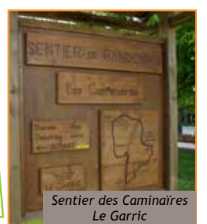
Sentier des Caminaires Le Garric