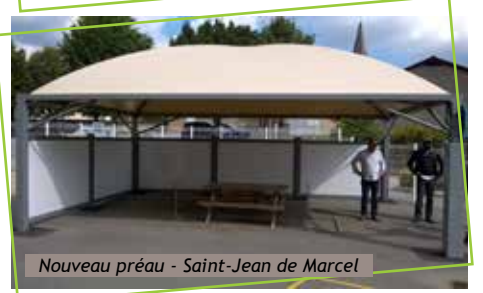
Nouveau préau - Saint-Jean de Marcel