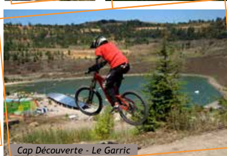
Cap Découverte - Le Garric