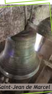
Saint-Jean de Marcel