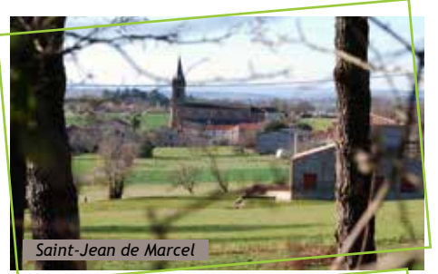
Saint-Jean de Marcel