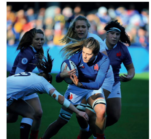
Gaëlle Hermet, capitaine du XV de France féminin France / Angleterre. Tournée d'automne 9 novembre 2019

MAZAMET – ESPACE APOLLO du 22/02 au 8/03 (Vernissage le 24 février à 18h) « La saga Spang'héros » - Collections particulières