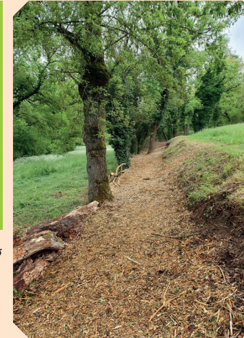
Entretien de sentiers

Conseil Départemental du Tarn, communes, Communauté de Communes Carmausin- Ségala