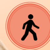
Mobilité du corps