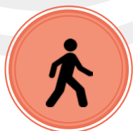
la mobilité du corps

Ce sont des tests simples et rapides qui vous permettent dès 60 ans, d'évaluer 6 fonctions.