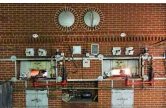
Le four de la biscuiterie

Une production familiale et artisanale grâce à une recette transmise depuis lors. En effet, le processus de fabrication est commun à tous les biscuitiers : une double cuisson, à l'eau d'abord puis au four, mais bien sûr, chacun a son secret !