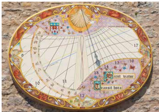
Création - Cadran solaire sur le thème des chemins de Saint-Jacques de Compostelle à Villefranche de Rouerge - 2013