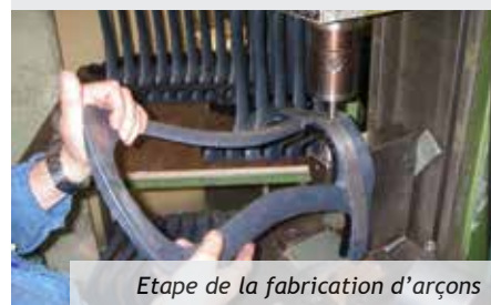
Etape de la fabrication d'arçons

Chaque archet est enfin répertorié afin de d'assurer une bonne traçabilité.