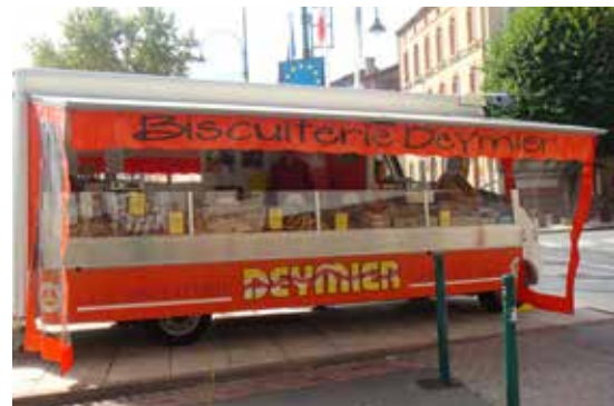
Sur le marché

L es échaudés de Carmaux, comme si l'un n'allait pas sans l'autre dans l'imaginaire collectif... C'est dire s'il s'agit d'une institution sur le territoire ! Les « classiques », les gros échaudés, les ronds, avec ou sans sucre... Les amateurs locaux ne s'en lassent pas, les visiteurs les découvrent au marché et même certains en commandent pour retrouver, avec nostalgie, le goût si singulier de ce biscuit à l'anis.