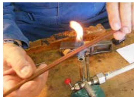
Etape de la fabrication d'archets

Dernières vérifications avant envoi, la beauté de l'archet finalisé est déjà une belle récompense.