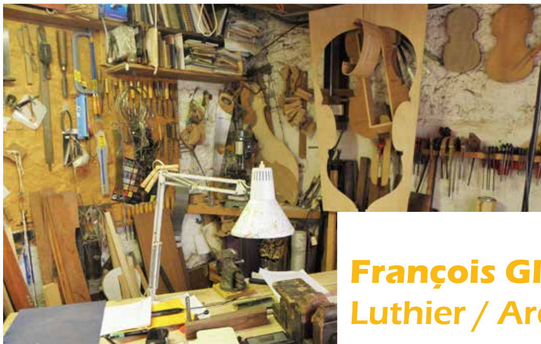
L'atelier de François Grimaux