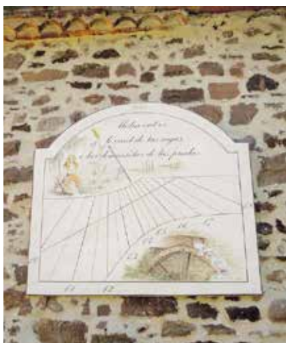
Création - Cadran solaire sur le thème du moulin à céréales de « la Prade » Salles-sur-Cérou 2013

On peut notamment citer en 2008, la restauration des cadrans solaires jumeaux de la cathédrale Sainte-Cécile d'Albi (Castor et Pollux) placés sur les faces intérieures des piliers du baldaquin et qui datent de 1658.