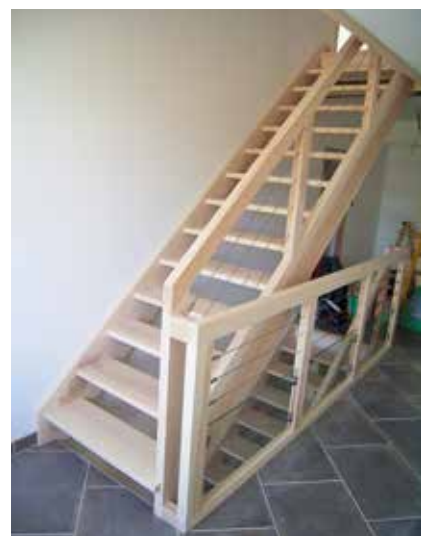
Escaliers droits sur deux étages