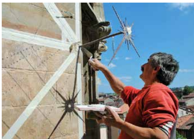
Restauration des cadrans de la cathédrale Sainte-Cécile d'Albi 2008 - Mise en place du « style », l'aiguille qui dont l'ombre marque l'heure