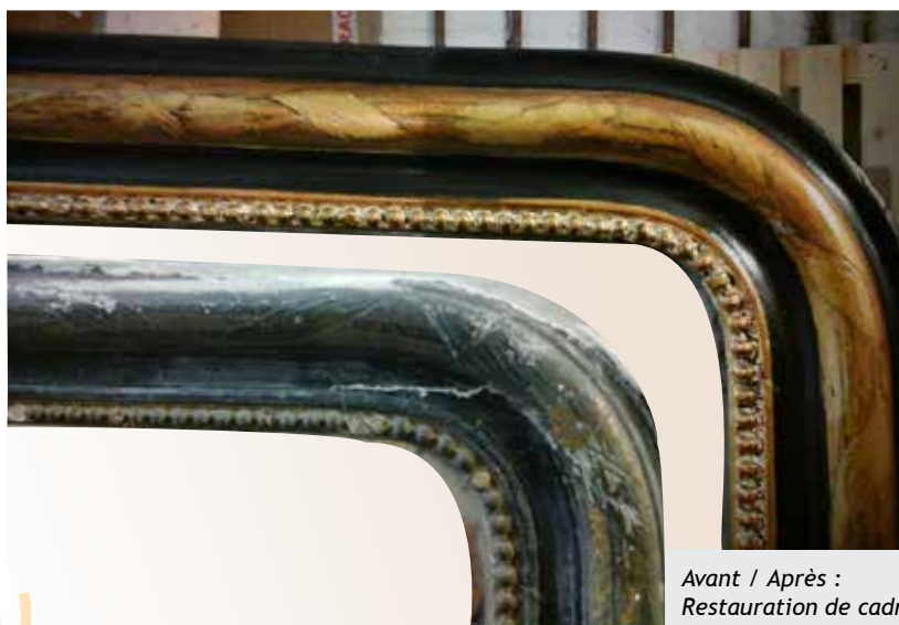
Avant / Après : Restauration de cadre

D'un point de vue esthétique bien sûr, il s'agit de respecter l'esprit de l'œuvre, la démarche du créateur, le souhait du propriétaire. Toute une palette de profils, de patines, des dorures à la feuille d'or, d'argent ou de cuivre... permet à l'encadreur de mener à bien sa mission : l'encadrement ne doit pas « trahir » l'œuvre ! Mais également du point de vue de la conservation de l'œuvre.