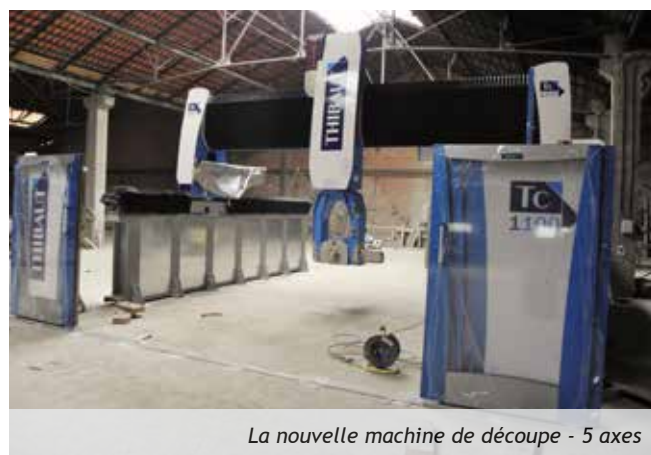
La nouvelle machine de découpe - 5 axes

Au-delà du savoir-faire technique et artistique, il est important d'avoir une vision d'avenir rappelle le tailleur de pierre. Il est aussi intéressant d'appréhender l'évolution des savoir-faire au regard des changements technologiques.