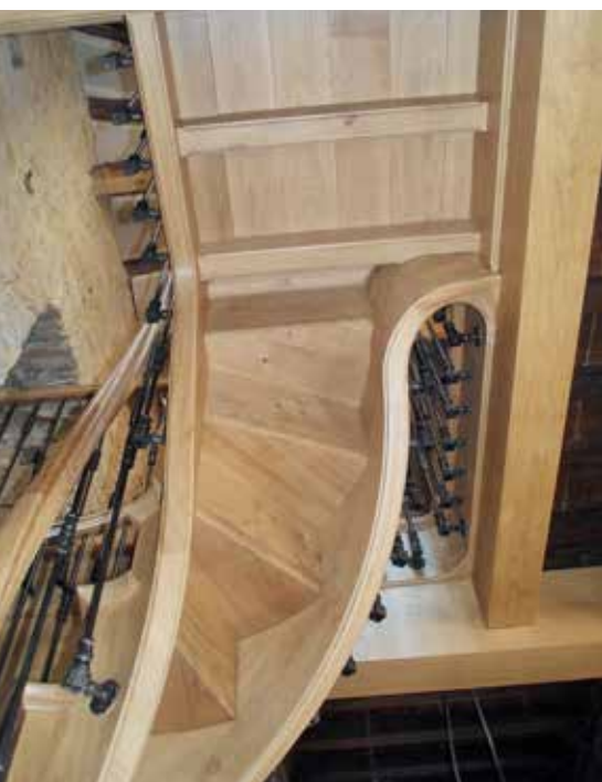
Escaliers à l'anglaise - technique ancienne

90% des ouvrages posés par l'entreprise sont fabriqués dans l'atelier