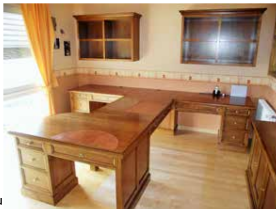
Création d'un bureau : un travail d'ébénisterie

C'est dans cette philosophie que travaille ce menuisier, qui, à son tour, pendant plusieurs années, a accueilli en formation des apprentis-compagnons.