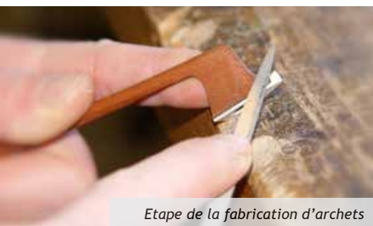
Etape de la fabrication d'archets

Craignant la disparition du savoir-faire archetier dans les années 1970, le Ministère de la Culture et le Groupement des Luthiers et Archetiers d'Art de France ont soutenu la création d'un atelier au sein de l'ASEI, qui a ainsi pu bénéficier de formation par un Maître-archetier.