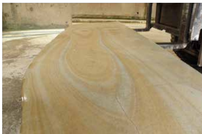
Grès de Molière

Les deux sites sont complémentaires puisque à Rosières, où travaillent deux personnes, est réalisée la découpe de gros blocs de pierre qui seront ensuite finalisés en Aveyron. ACM possède également plusieurs carrières d'extraction dont une principale située en Aveyron d'où provient le grès de Molière.