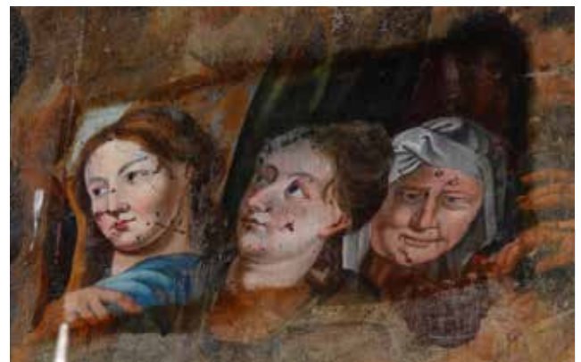
Détail du retable - projet en cours Eglise Saint Salvy de Fournials - Tanus

Ces conventions étant ciblées sur des futurs projets répondant à des critères précis et déterminés par le partenaire ou le mécène.