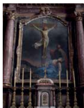
Crucifixion avec La Vierge et St Jean Eglise Saint Pierre / Monestiés AVANT - APRES TRAVAUX

La Fondation du Patrimoine étudie votre projet puis vous notifie son avis. Si votre dossier est accepté vous pourrez lancer une campagne de mobilisation de mécénat populaire et d'entreprises sous l'égide de la Fondation du Patrimoine , encadrée par une convention de souscription.