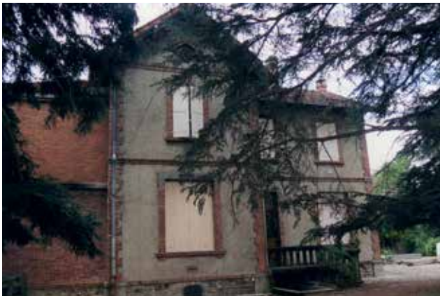
Maison à Blaye-les-Mines AVANT - APRES TRAVAUX

Les propriétaires privés d'un bien immobilier présentant un intérêt patrimonial, non protégé au titre des Monuments Historiques, peuvent prétendre à une aide de la Fondation du Patrimoine en obtenant un label pour le restaurer. Ce label vous permettra d'obtenir une aide fiscale de l'Etat. Pour cela, il vous faut répondre à certains critères.