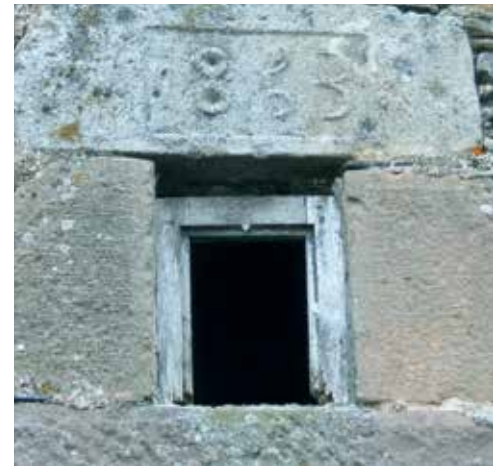
Détail d'une maison - Le Ségur AVANT - APRES TRAVAUX

◆ Vous joignez à votre déclaration de revenus une copie de la décision d'octroi du label et un récapitulatif des travaux effectués et payés.